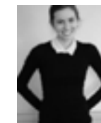
Linnea Frank, fotograf