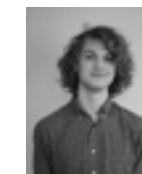
Oscar Schau, fotograf